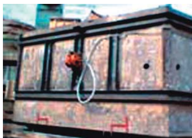
Zagęszczanie piasku formierskiego