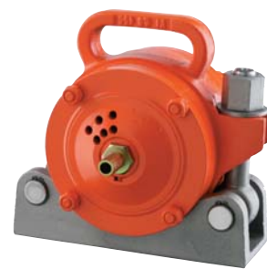
NVT 87 z mocowaniem NVH 4